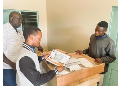
nieuwe couveuses in elkaar zetten