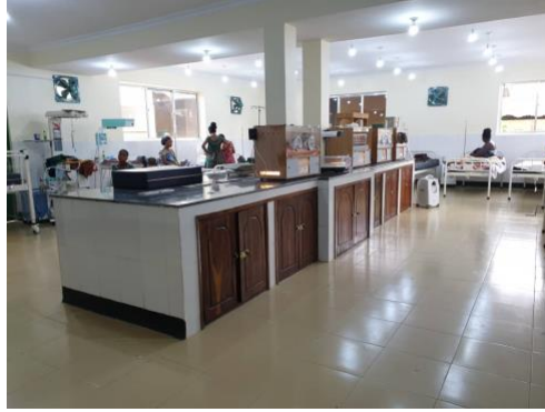
De nieuwe NICU